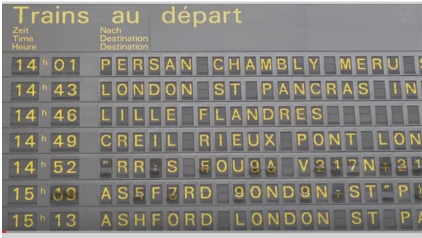
FIGURE 3 – Panneau d'affichage à palettes mécaniques d'une gare ferroviaire.

Une suite numérique u ressemble aux lignes d'un tableau d'affichage électromécanique, figure 3.